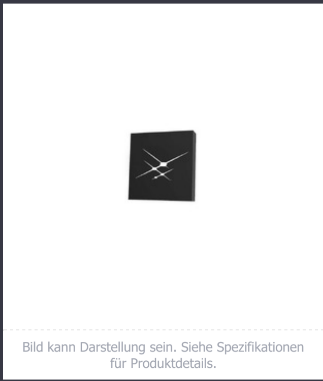
Bild kann Darstellung sein. Siehe Spezifikationen für Produktdetails.